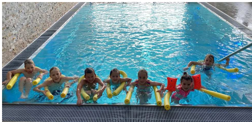
Schwimmen in St. Jakob