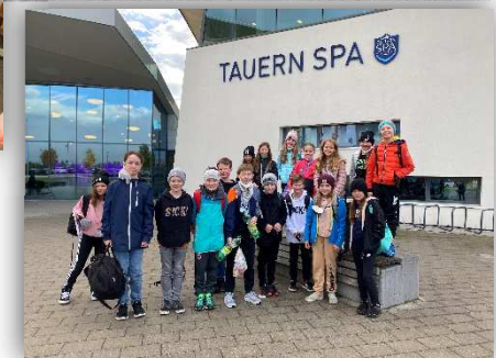
Impressionen von der Schwimmwoche der 1a in Mittersill