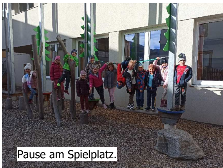
Pause am Spielplatz.