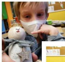
Engel für das Christkind