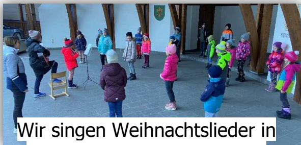
Wir singen Weihnachtslieder in der frischen Luft im Pavillon.