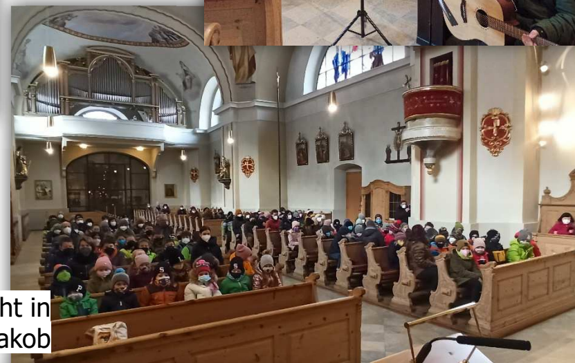
Weihnachtsandacht in St. Jakob