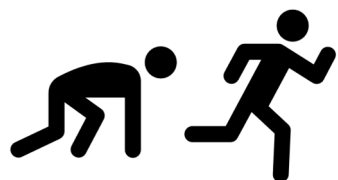
Staffelläufe auf dem Feuerwehrparkplatz