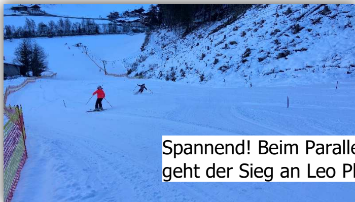
Spannend! Beim Parallellalom geht der Sieg an Leo Ploner. 🏆

Mit dem selbstgebauten Thermometer wurden Versuche gemacht.