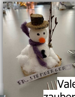
Valentina zauberte für uns einen wundervollen Tischschmuck.