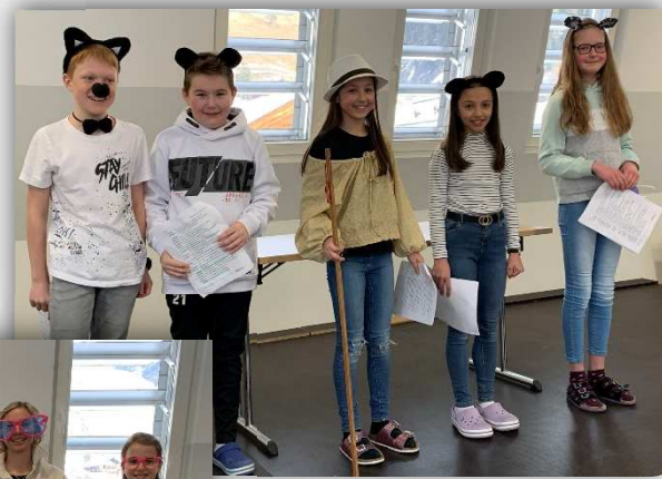
Lesetheater präsentiert von der 1a Klasse